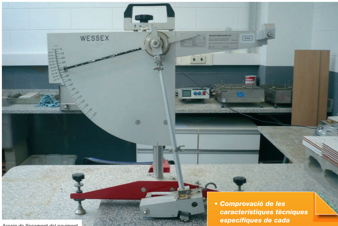
Assaig de lliscament del paviment.