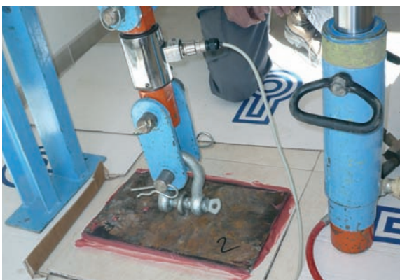
Adherència del paviment.