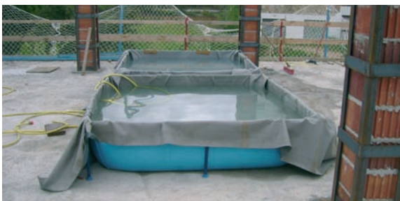
Proves de càrrega.