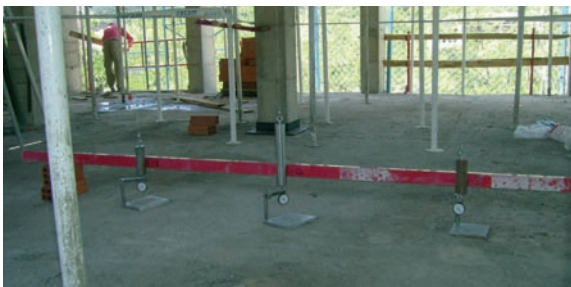
Proves de càrrega.