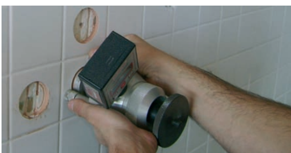
Adherència de l'aplatat.