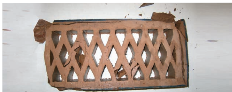
Assaig de gelivitat en obra vista.