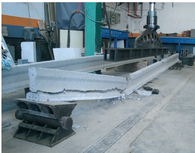
Assaig de flexió de bigues.