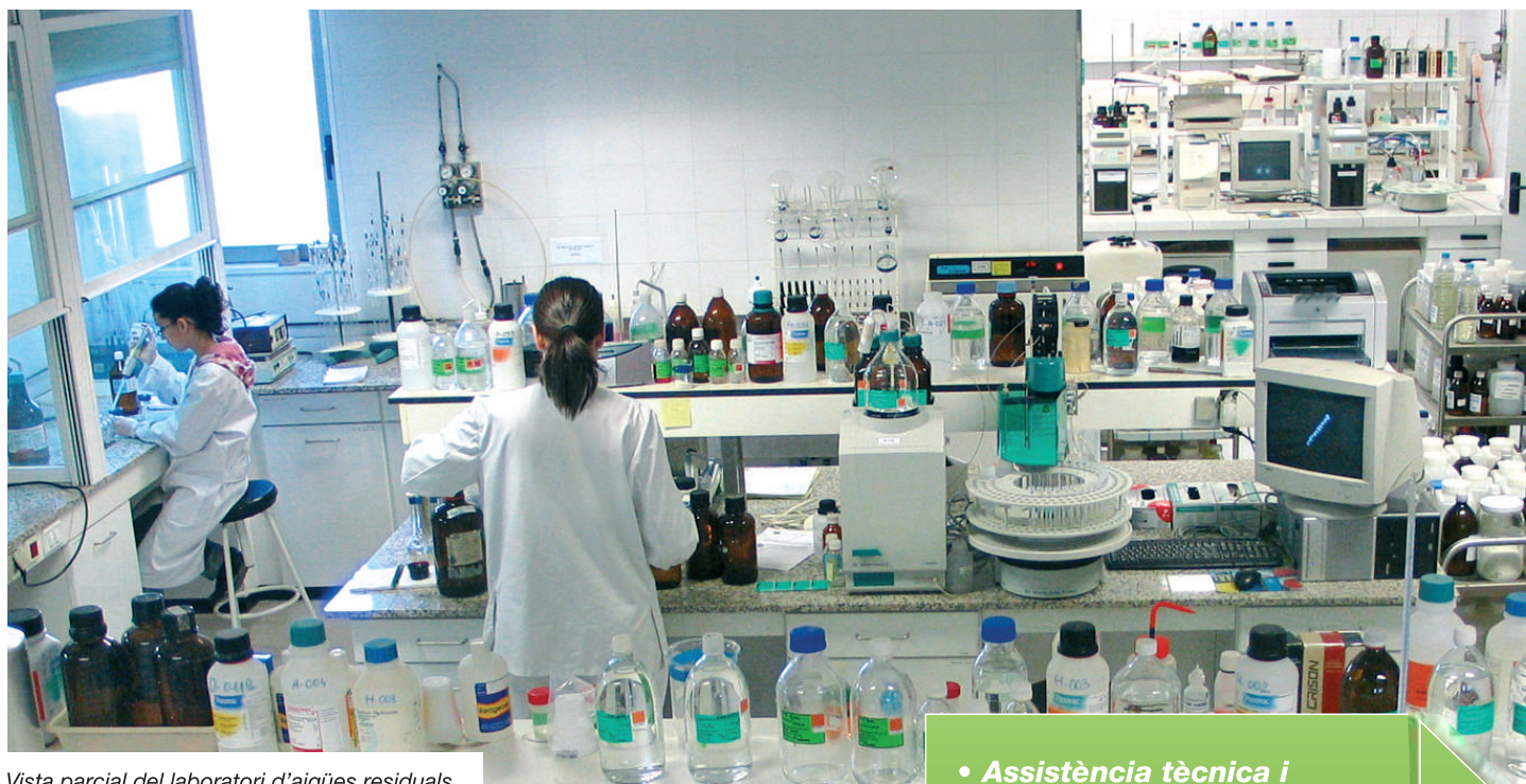
Vista parcial del laboratori d'aigües residuals.

L'Àrea de Medi Ambient ofereix un servei d'assistència analítica i tècnica orientat a donar suport a empreses l'activitat principal de les quals pot ser molt diversa, d'acord amb la Classificació Catalana d'Activitats Econòmiques de 2009: alimentàries, químiques, hoteleres, tèxtils, tractament de superfícies, extractives, papereres, adobadors, entre altres (Decret 137/2008).