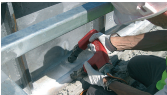
Inspecció no destructiva per a partícules magnètiques.