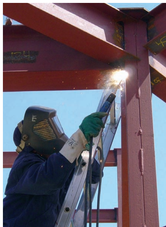
Inspecció en soldadures.

Per controlar les unions roscades es fa mesura estàtica amb claus dinamomètriques.