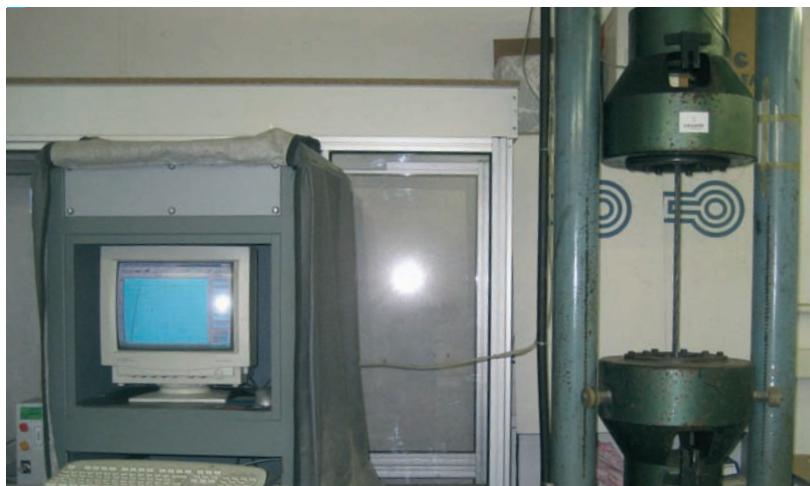
Assaig de tracció.