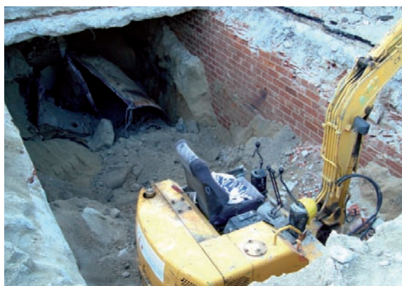
Excavació de sòls contaminats.