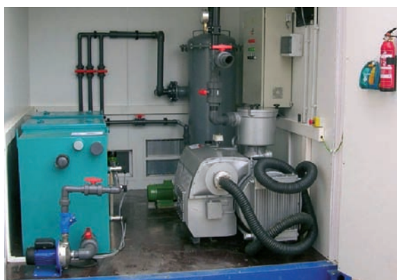
Equips de descontaminació de sòls.