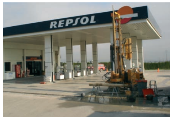
Sondeigs de reconeixement en estacions de servei.