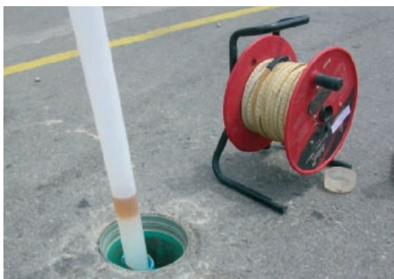
Mostreig d'aigua subterrània afectada.