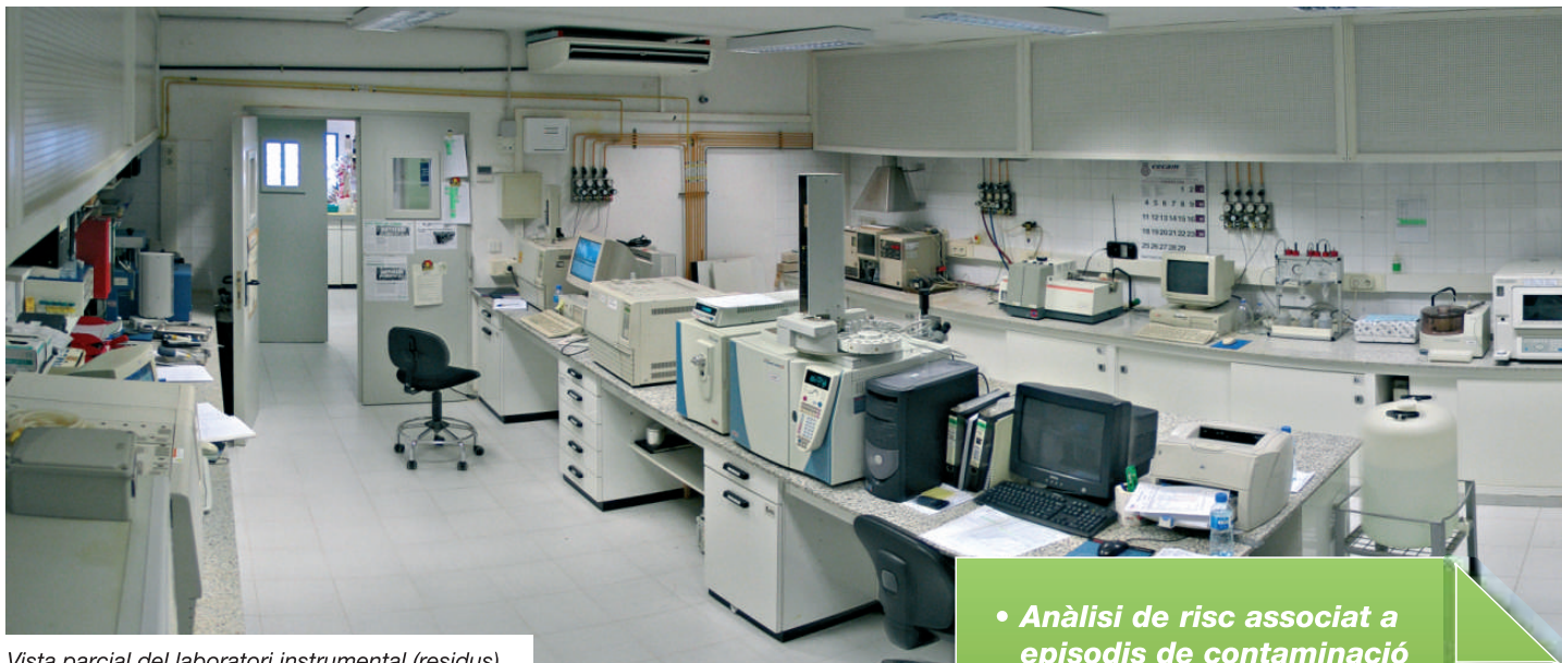
Vista parcial del laboratori instrumental (residus).

L'Àrea de Geologia Ambiental de CECAM ofereix tots els serveis relacionats amb la gestió de sòls i aigües subterrànies potencialment contaminats, així com els serveis i tecnologies per a la seva descontaminació i recuperació.