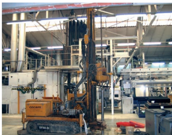
Sondeigs de reconeixement.