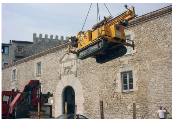
Emplaçament amb grua d'una de les cinc penetrosondes TP50-D per a la realització d'un estudi geotècnic per a la Universitat de Girona.

Les actuacions indicades representen una base a partir de la qual l'Àrea s'ofereix també per a la realització de diversos estudis: