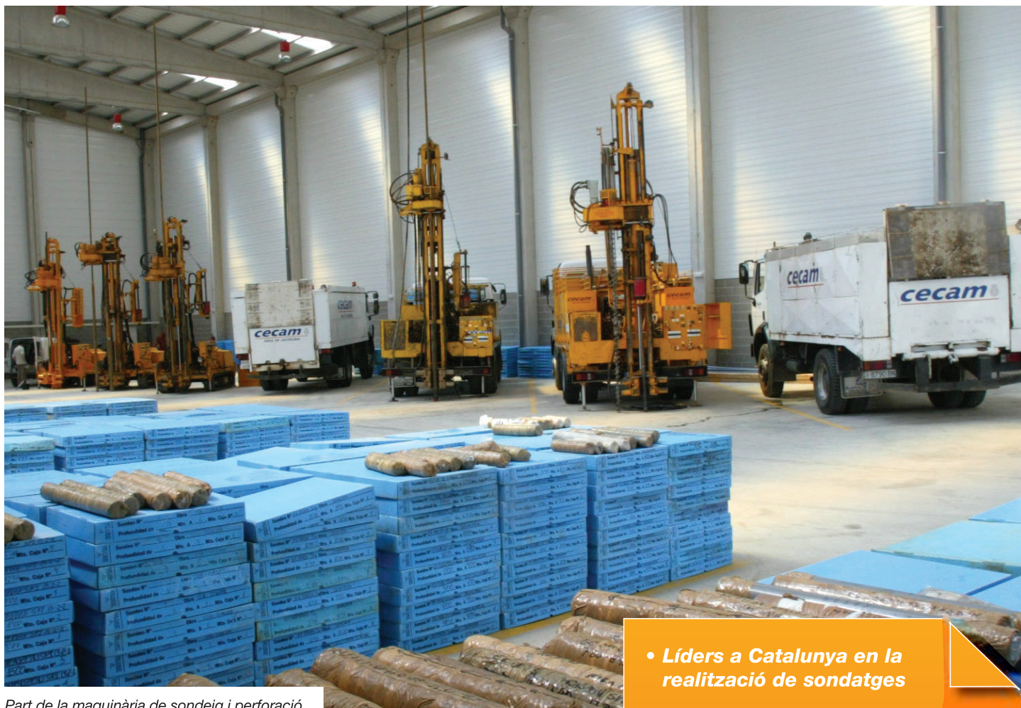
Part de la maquinària de sondeig i perforació.

L'Àrea de Geologia i Geotècnia ofereix diversitat de serveis relacionats amb el reconeixement del terreny de cares a satisfer al màxim les necessitats plantejades en el món de la construcció, del medi ambient i de l'explotació dels recursos minerals. El seu àmbit d'actuació és tot l'Estat espanyol i com a treballs de camp ofereix els serveis següents: