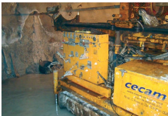
Realització d'un sondatge horitzontal a la Línia 5 del Metro de Barcelona.