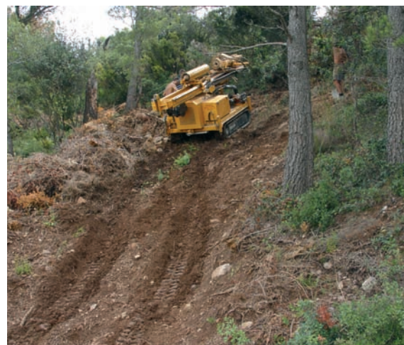
Accés a un punt de sondatge del tram del TAV a Sarrià de Ter.