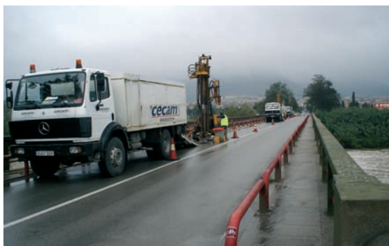
Realització de sondatges a les piles del pont del riu Ter a Torroella de Montgrí.