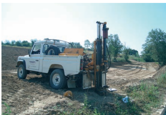
Execució d'una prova de penetració dinàmica superpesant en un tram del TAV a Vilademuls.