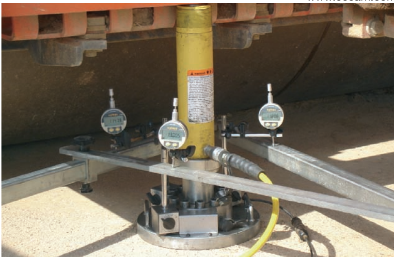
Assaig de placa de càrrega.