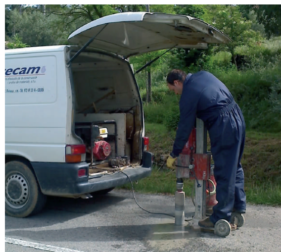
Extracció de testimonis d'aglomerat.